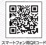
スマートフォン用QRコード

演目等詳細は、下記のページをご覧ください。 「親子で楽しむ歌舞伎教室」ご予約専用ページ https://ticket.ntj.jac.go.jp/oyako2025/index.html