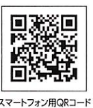
スマートフォン用QRコード