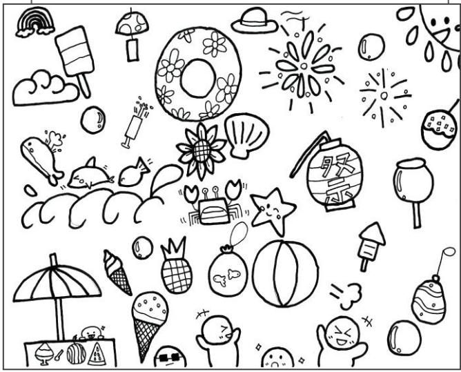
低学年用 歯みがきカレンダーは5年生の作品です。